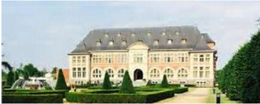
Zetellaan, 68 te 3630 Maasmechelen (op 100m van Maasmechelen Village)

Deze activiteit start om 14 uur en we vragen jullie om 13h45 ten laatste samen te komen aan de voorzijde van het TERILLS HOTEL. Aan de overkant van de straat is er een ruime parking (Eurocoop, Village Maasmechelen)